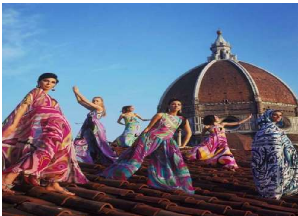
Campagna pubblicitaria Pucci, 1967 Firenze